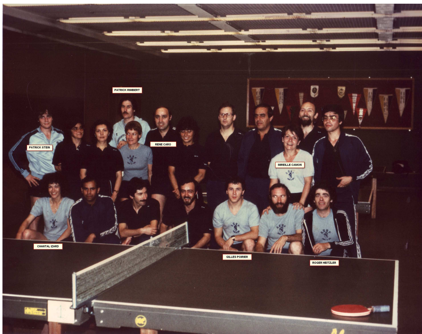
Photo de la section en 1979