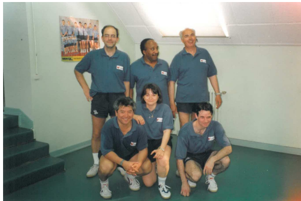
VAPILLON – BOUCARD-GERMANY X ? - SENILHES-LALEU